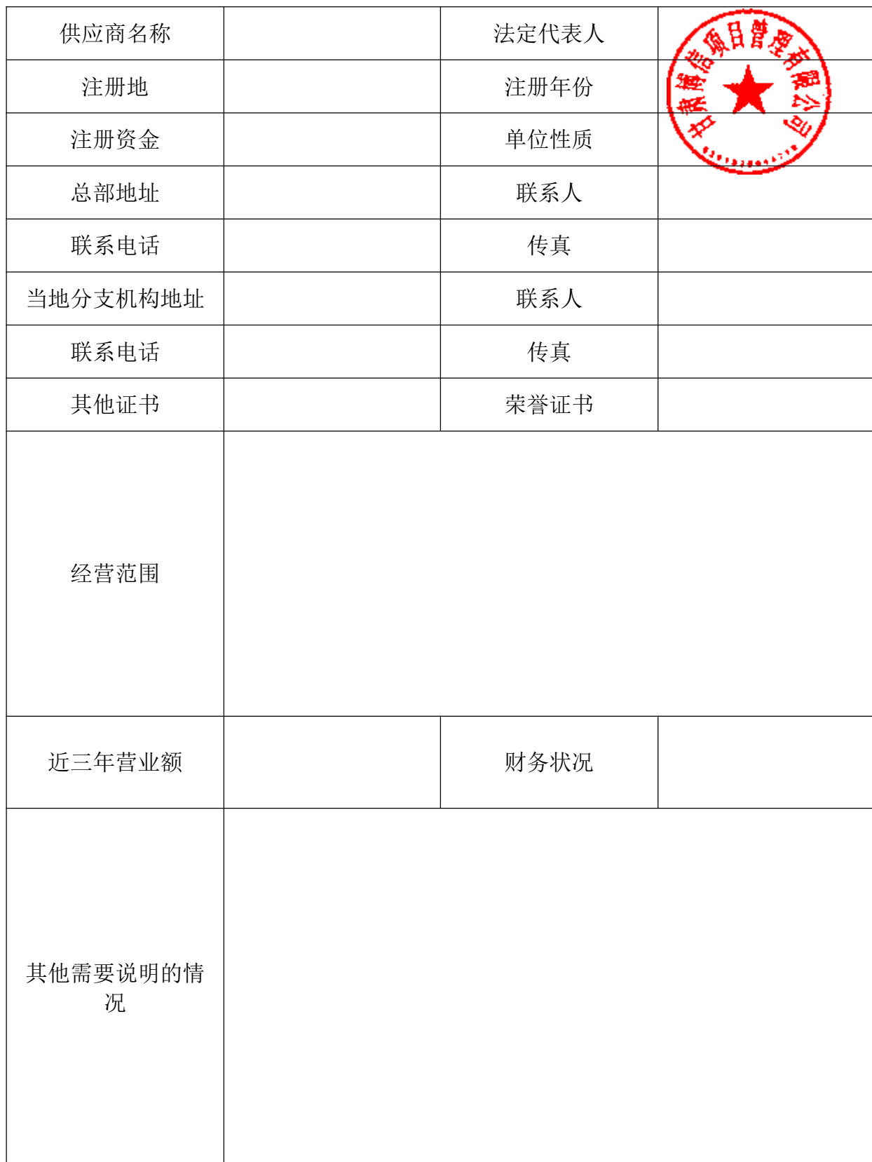
供应商基本情况一览表